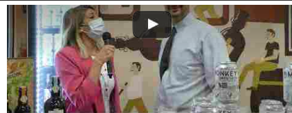
altri video su beverfood.com Channel

Museo Virtuale , presenta oggi la versione digitale del suo Archivio Storico . Un patrimonio oggettuale, audiovisivo e documentale preziosissimo, completamente inventariato su supporto digitale e ora in larga parte disponibile online, che racchiude 175 anni di storia aziendale e interseca tappe fondamentali della storia industriale e sociale italiana.